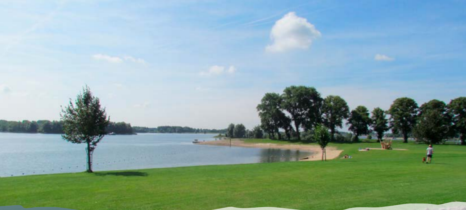
Recreatiepark De Veerstal met daaronder de jachthaven en de baai.

In verschillende overleg- en schetssessies is stapsgewijs gezocht naar een meer gedragen plan op hoofdlijnen. Inmiddels heeft een aantal van de betrokken organisaties zich verenigd in het IGOR (Integraal Gebiedsoverleg Rhederlaag). Ook K3Delta en Leisurelands maken daar onderdeel van uit. Het IGOR zet zich in voor een evenwichtige en duurzame ontwikkeling en beheer van het Rhederlaag op de lange termijn.